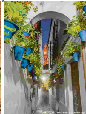
Cordoba, Foto: Adobe Stock, Anibal Trigo