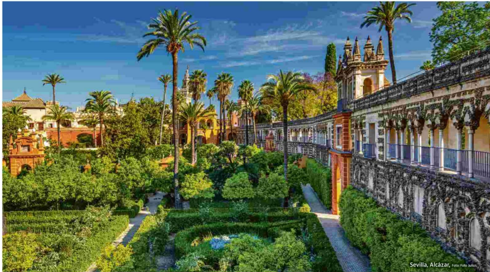
Sevilla, Alcázar, Foto: Foto Julius