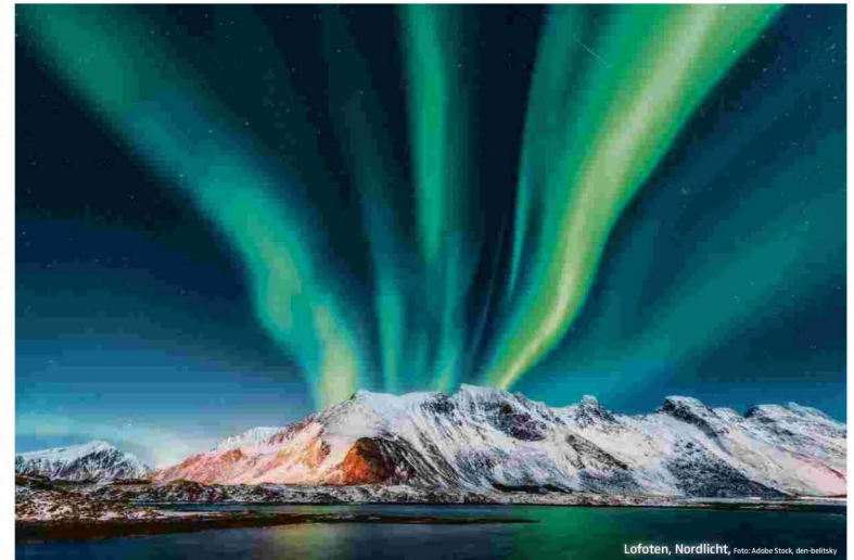
Lofoten, Nordlicht

Ruhe des Winters. Die Wintermetropole Tromsø ist die kulturelle Hauptstadt in dieser Region nördlich des Polarkreises, sie ist für die Beobachtung des Polarlichts ideal. Und in dieser Stadt bewundern wir auch die Eismeererkathedrale mit einem der größten Glasmosaik Europas. Eine Polarlichtsafaris ist bei Kneissl natürlich inkludiert, aber vielleicht bekommt man Lust auf mehr, dann gibt es auch die Möglichkeit, das Nordlicht von einem Katamaran aus zu beobachten (fak.) oder im Husky Schlitten (fak.). Ungewisslich ist der Besuch bei den Samen, die kurze Fahrt mit dem Rentierschlitten und der wärmende traditionelle Eintopf hinterher.