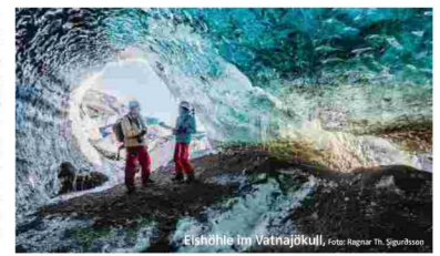
Eishöhle im Vatnajökull

nach Kirkenes zum Nordkap und retour unterwegs, aber mit unterschiedlichen Anlegehäfen und Programm/Ausflügen. Bevor es in Bergen an die Einschiffung geht, begeistert die Fahrt mit der Bergenbahn von Oslo nach Bergen. Vom Hurtigruten Schiff genießt man – erste Reihe fultfrei – einen wunderbaren Ausblick auf die verschneite Fjordlandschaft. Und wo könnte man Nordlichter entspannt beobachten als an Bord eines bequemen Schiffes? Mit durchgehender Kneissl-Reiseleitung, auch bei den Spaziergängen und Ausflügen an Land, z. B. auf den Lofoten.