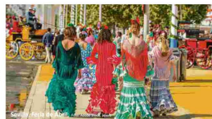
Sevilla, Feria de Abril, Foto: Corbis/Alamy

Sevilla Die Stadt zeigt ebenfalls ein faszinierendes Mosaik verschiedenster Kultu-