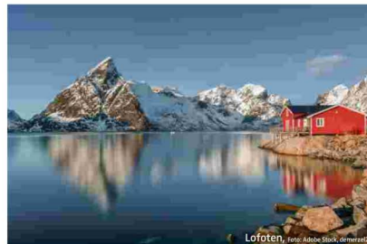
Lofoten, Foto: Adobe Stock, dener21

Eine der schönsten Inselgruppen Norwegens, die Lofoten, sind im Winter am schönsten: Die ursprüngliche Atmosphäre der malerischen Fischerdörfer mit ihren Stockfischständen ist intakt, herrlich sind die klare Luft, die faszinierenden Lichtverhältnisse, die